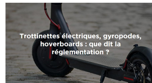
Trottinettes électriques, gyropodes, hoverboards : que dit la réglementation ?

Les trottinettes électriques comme tous les engins de déplacement personnel motorisés (EDPM) ont fait l'objet d'un relèvement de l'âge minimum à 14 ans et non plus 12 ans ainsi que d'une augmentation significative des amendes sur certaines infractions. https://www.securite-routiere.gouv.fr/reglementation-liee-aux-modes-de-deplacements/reglementation-des-edpm Depuis la création en 1972 du premier Comité interministériel de la sécurité routière (CISR) le nombre d'accidents, de tués et de blessés a été divisé par 6. Le CISR du 17 juillet 2023 a élaboré 38 nouvelles mesures qui permettront de faciliter la vie des usagers, d'améliorer la prévention et de mieux détecter et sanctionner les conducteurs sous emprise d'alcool et/ou stupéfiants. La première ministre, présidente de ce CISR, a également confirmé l'abaissement de l'âge du passage du permis de conduire à 17 ans dès janvier 2024. https://www.gouvernement.fr/actualite/permis-passtrain-de-nouvelles-mesures-en-faveur-des-jeunes https://www.haute-saone.gouv.fr/Actions-de-l-Etat/Securite-et-protection-des-personnes/Securite-routiere/National/Comite-Interministeriel-de-la-Securite-Routiere-CISR